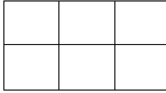
قماش رقم 2 للتصنيف