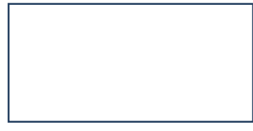
قماش رقم 1 للفرز

. وضع المجسّدات على الطاوولات بصفة متباعدة لاجتناب الازدحام والتصادم.